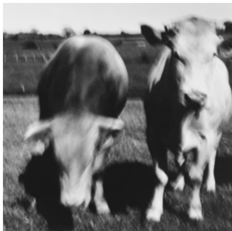
Chrystèle LERISSE 044-004